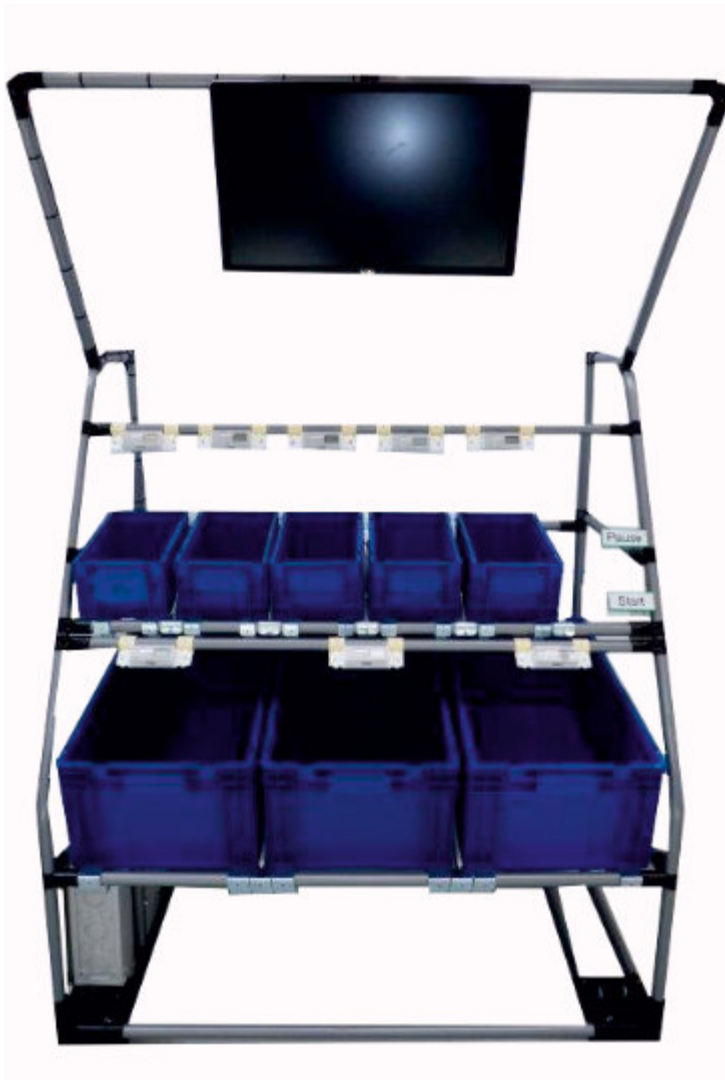
Pick by Light System in Kombination mit einem ECO-Rohr Regal